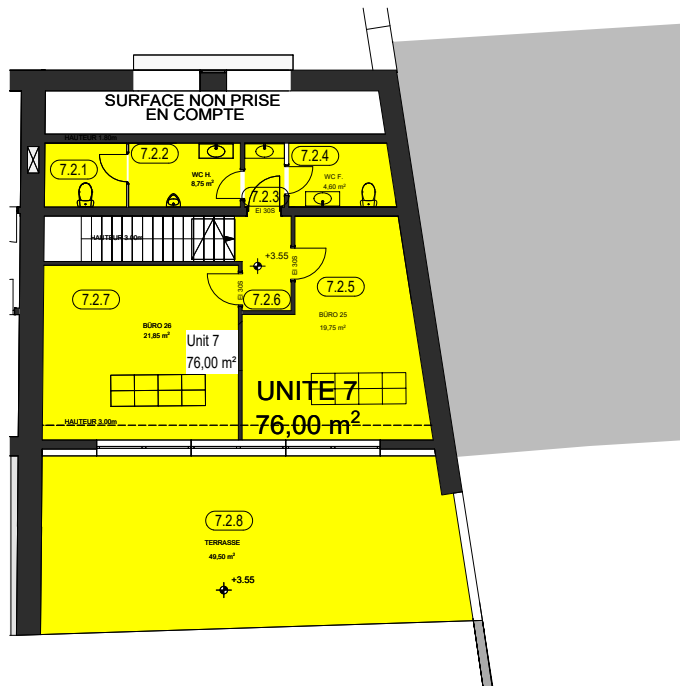
Grundriss 1.Obergeschoss (Unit 7)