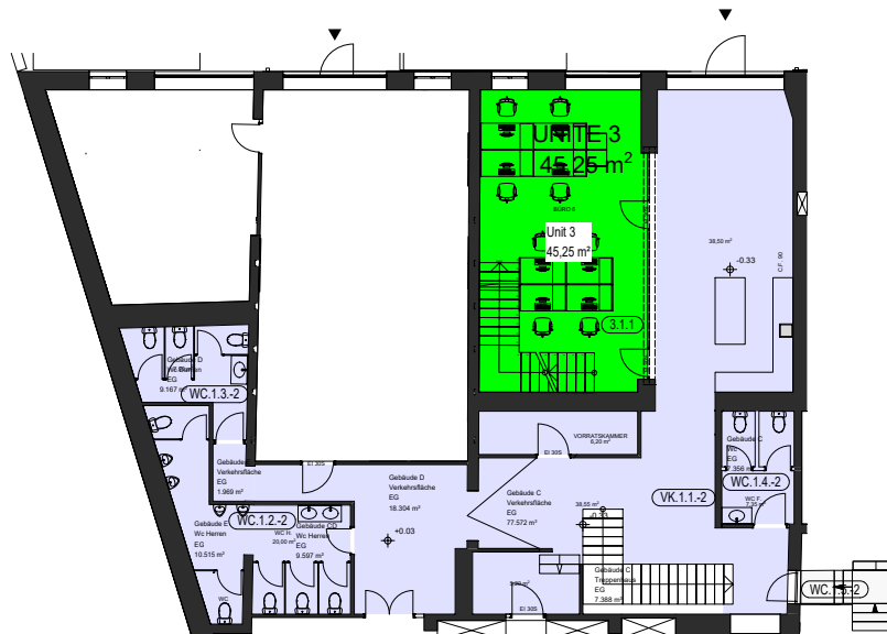
Grundriss Erdgeschoss (Unit 3)