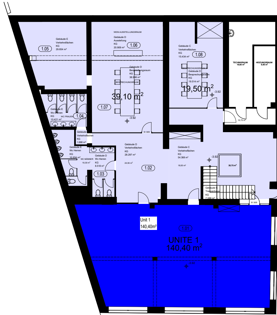
Grundriss Kellergeschoss (Unit 1)